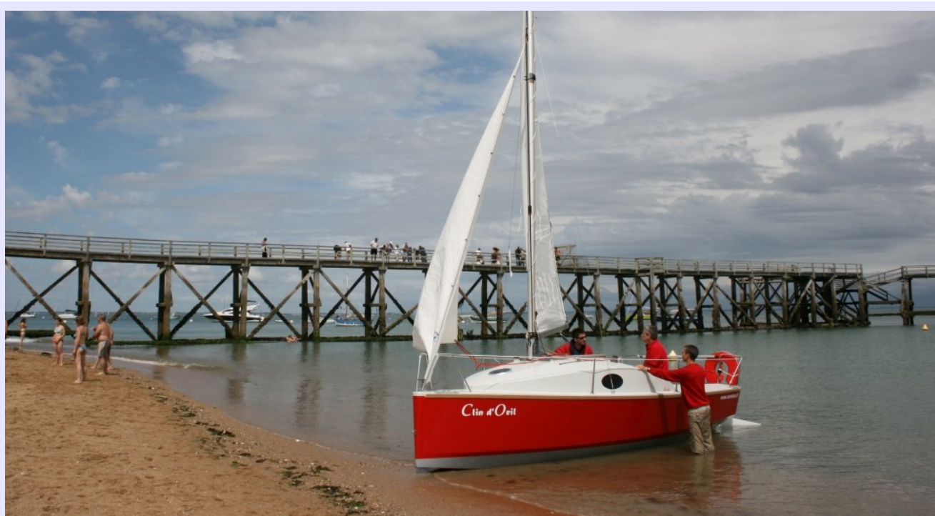
Le plaisir sans contraintes