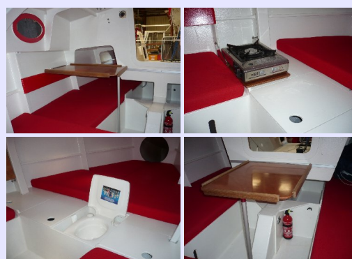
Intérieur clair et confortable